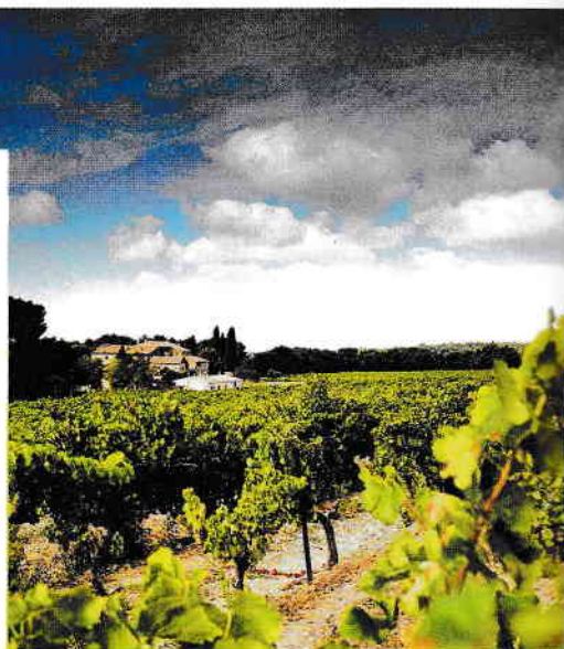
20 JUILLET 2021

Domaine de la Camarette. 439, chemin des Brunettes, Pernes-les-Fontaines (84). Tél. : 04 90 61 60 78. domaine-camarette.com